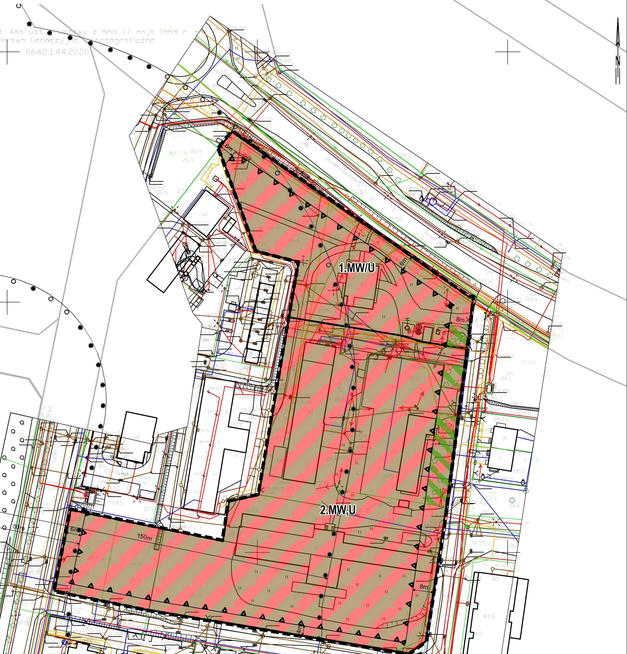
Wyrys ze Studium uwarunkowań i kierunków zagospodarowania przestrzennego miasta Pruszcz Gdański

z art. 48a ust. 1 ustawy z dnia 17 maja 1989 r. - Prawo Geodezyjne i Kartograficzne 6642.1.44.2020